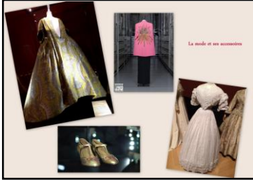
La mode et ses accessoires